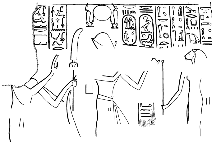
Рис. 2. Сиптах приносит жертвы богине Бастет, за его спиной находится сановник, чье имя не сохранилось (по мнению автора, Баи) (рельеф на колонне 16 храма Хора в Бухене)

подчеркнуть свое происхождение от Мернептаха. В его правление власть фактически находилась в руках Баи, который, судя по его титулу «великого начальника казны», должен был сосредоточить в своих руках громадные ресурсы. Однако в 5-й год правления Сиптаха он был казнен и объявлен «великим врагом», в чем, без сомнения, следует видеть триумф для Таусерт и ее приверженцев (независимо от того, что инициировало конфликт, приведший к казни Баи. При XX династии Баи упоминается в папирусе Harris I как наиболее значимая и одиозная фигура, олицетворявшая хаос и скверну, по мнению создателей папируса (т.е. по официальной концепции XX династии), охватившие Египет в конце XIX династии.