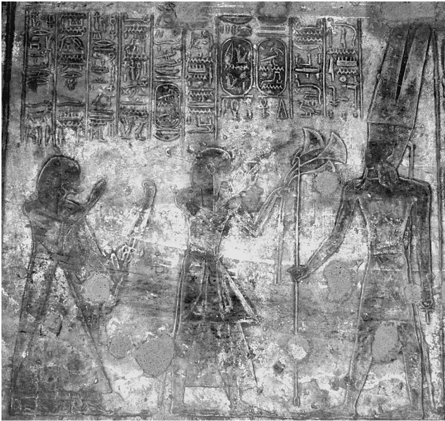
Рис. 1. Сиптах жертвует Амону-Ра связку лотосов, а за ним стоит Баи (рельеф, Гебель эс-Силсиле)

Это дало основание полагать, что Баи мог претендовать на отправление своего заупокойного культа в храме фараона 16 . Кроме того, на изображениях Сиптах постоянным спутником фараона всегда является Баи (рельефы в Дейр эль-Бахри, Гебель эс-Силсиле 17 , Асуане) 18 (см. ниже) 19 . Любопытно, что подписи к рельефу в Асуане Баи именуется как rwj grg dj m3ct – «изгоняющий ложь, дающий правду» 20 . Подобный эпитет уместен применительно к фараону 21 , а вот его